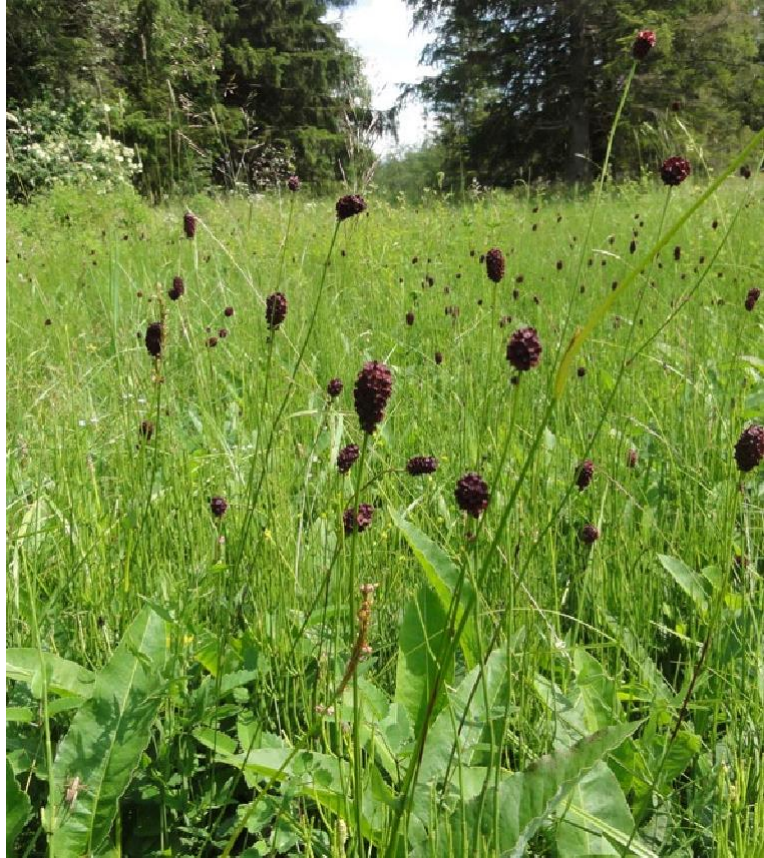
Groß-Bibernelle (grünes handwerk - M. Ressel)