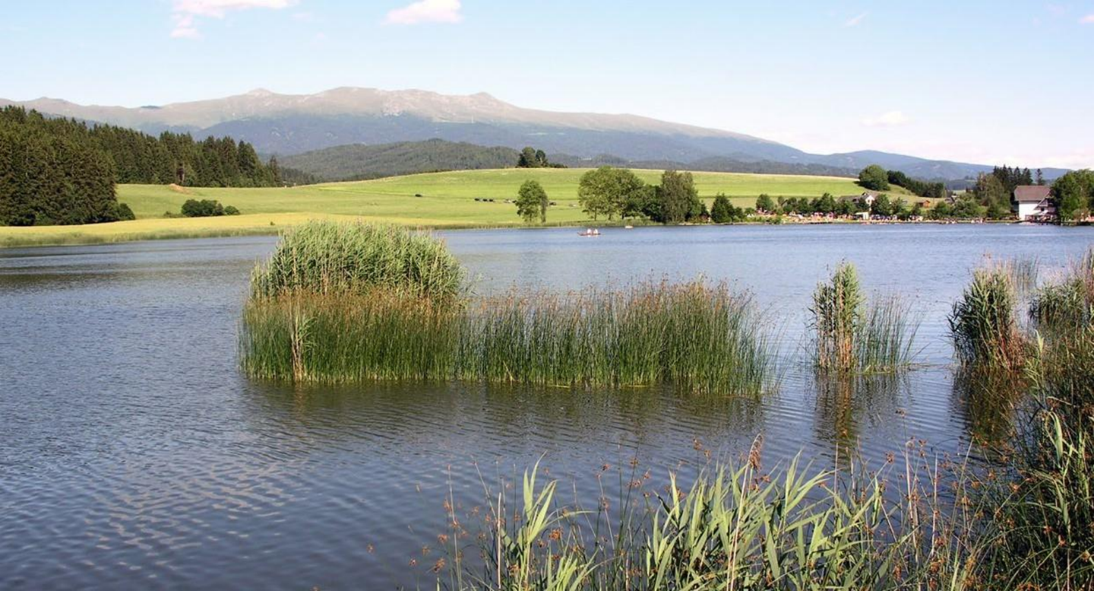
Furtner Teich (P. Hochleitner)