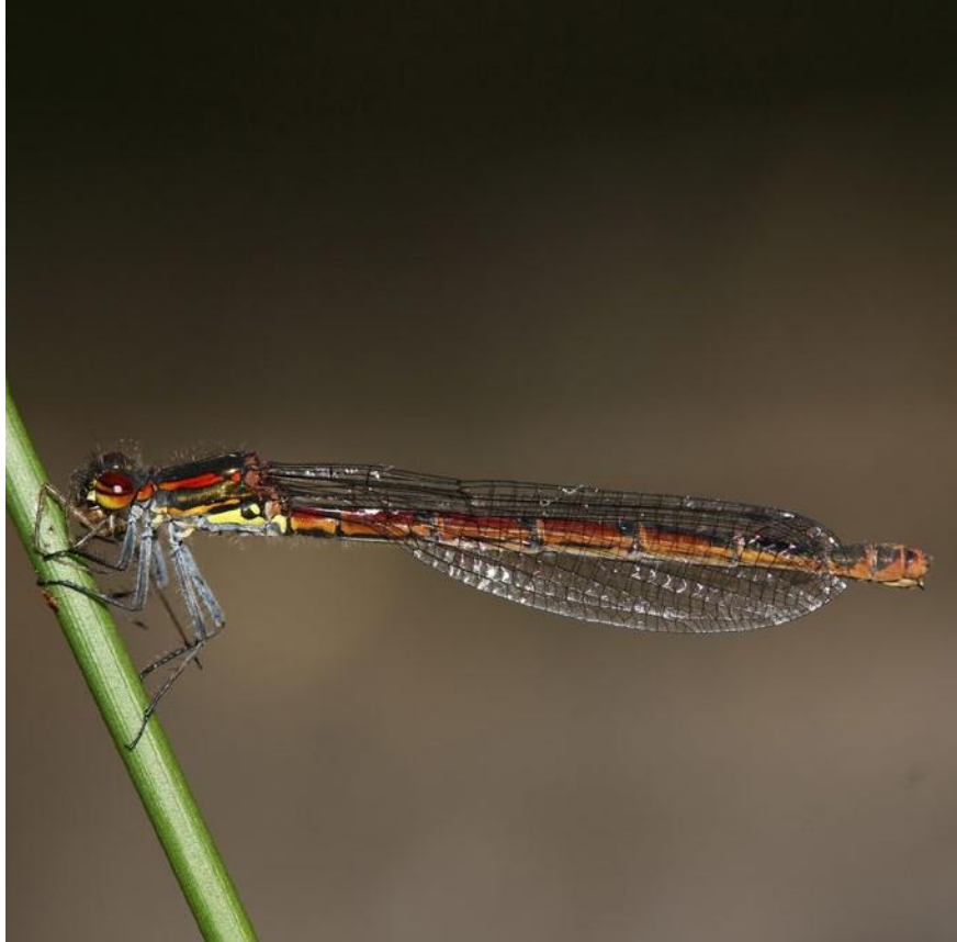
Frühe Adonislibelle

( Caltha palustris ), Sumpf-Labkraut ( Galium palustre ), Engelwurz ( Angelica sylvestris ), Sumpf-Herzblatt ( Parnassia palustris ) und Teufelsabbiss ( Succisa pratensis ) zu finden.