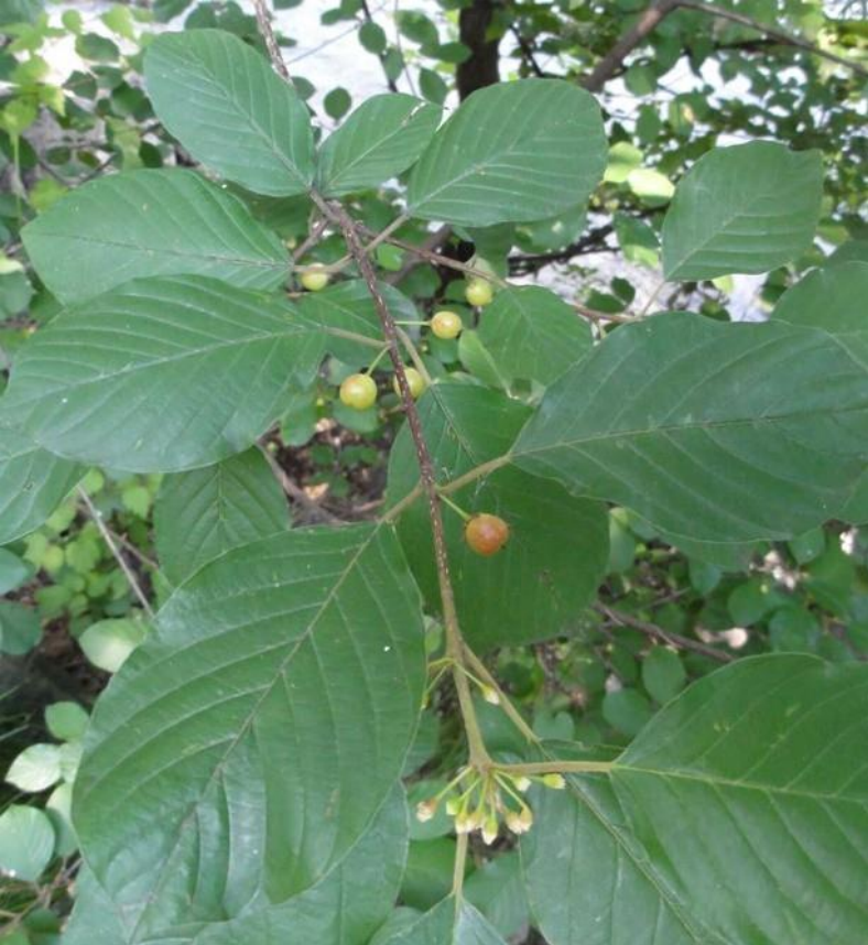
Faulbaum (grünes handwerk - M. Ressel)